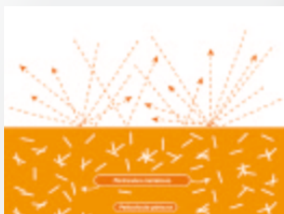
Antes de la aplicación