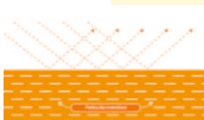
Después de la aplicación