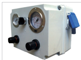
Máquina soldadora de plástico