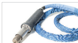
Pistola de soldar